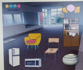
Pomôžte nám zariadiť priestory pre mladých