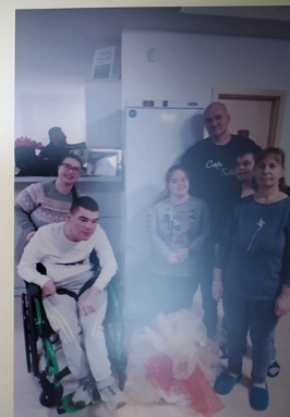
Máme novú chladničku