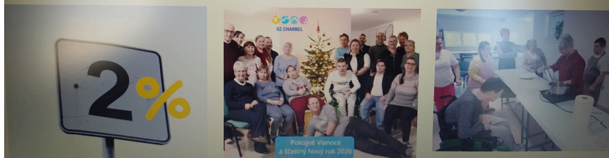
8. Január 2026 | autor: Míška | 0