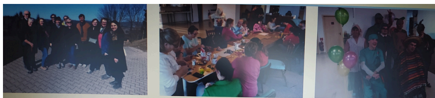
Máme zastúpenie v komore counselorov